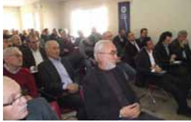
18. Genel Kurul salonundan bir fotoğraf