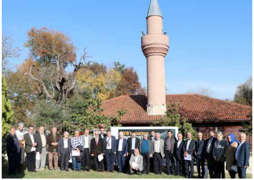
TYB Şubeler Buluşması 06.11.2022 günü Şeyh Şeyh Müslihiddin Camii'nde gerçekleşti.